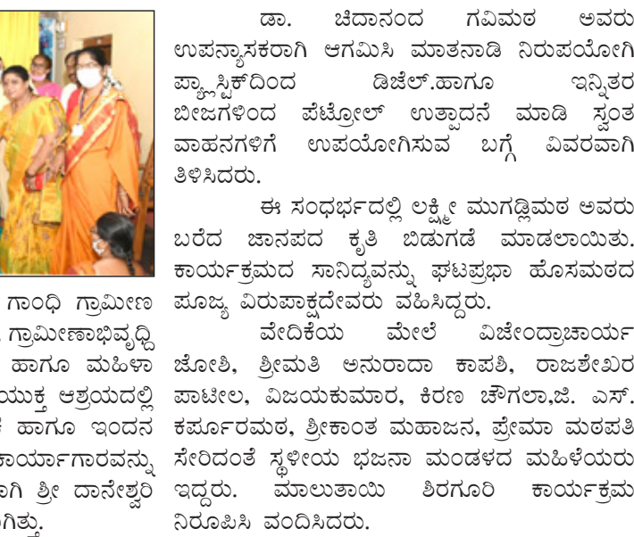
ಘಟಪ್ರಭಾ,ಜ.09: ಮಹಾತ್ಮಾ ಗಾಂಧಿ ಗ್ರಾಮೀಣ ಇಂದನ ಅಭಿವೃದ್ಧಿ ಸಂಸ್ಥೆ ಬೆಂಗಳೂರು, ಗ್ರಾಮೀಣಾಭಿವೃದ್ಧಿ ಮತ್ತು ಪಂಚಾಯತ ರಾಜ್ಯ ಇಲಾಖೆ ಹಾಗೂ ಮಹಿಳಾ ಕಲ್ಯಾಣ ಕೇಂದ್ರ ಬೆಳಗಾವಿ ಇವರ ಸಂಯುಕ್ತ ಆಶ್ರಯದಲ್ಲಿ ಕಚ್ಚಾಸಸ್ಯಗಳಿಂದ ಇಂದನ ತಯಾರಿಕೆ ಹಾಗೂ ಇಂದನ ಉಳಿತಾಯದ ಒಂದು ದಿನದ ಕಾರ್ಯಾಗಾರವನ್ನು ಸ್ವಸಹಾಯ ಸಂಘಗಳ ಮಹಿಳೆಯರಿಗಾಗಿ ಶ್ರೀ ದಾನೇಶ್ವರಿ ಎನ್.ಟಿ.ಸಿ.ಕಾಲೇಜಿನಲ್ಲಿ ಹಮ್ಮಿಕೊಳ್ಳಲಾಗಿತ್ತು.