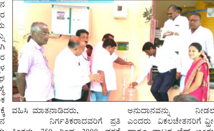
ವಹಿಸಿ ಮಾತನಾಡಿದರು. ಅನುದಾನವನ್ನು ನೀಡಲಾಗುತ್ತಿದೆ ಎಂದರು. ವಿಕಲಚೇತನರಿಗೆ ಉಚಿತವಾಗಿ ವಿತರಿಸಲಾಗುವುದು ಎಂದು. ಶ್ರೀ 99ರಷ್ಟು ಕಾರ್ಯಕ್ರಮಗಳು ಸಮಾಜಕ್ಕೆ ಹಾಗೂ ಸಮಾಜದ ಒಳಿತಿಗಾಗಿ ಪೂಜ್ಯ ವೀರೇಂದ್ರ ಹೆಗಡೆಯವರು ರೂಪಿಸಿದ ಯೋಜನೆಗಳನ್ನು ಪ್ರತಿ ಹಳ್ಳಿಗಳಲ್ಲಿ ಶುದ್ಧ ನೀರು, ಬಯಲು ಶೌಚಾಲಯಗಳ ಮುಕ್ತ ಗ್ರಾಮ ನಿರ್ಮಾಣಗಳಂತ ಯೋಜನೆಗಳು ಜಾರಿ